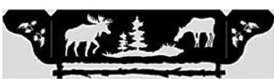
20" Shelf Bracket