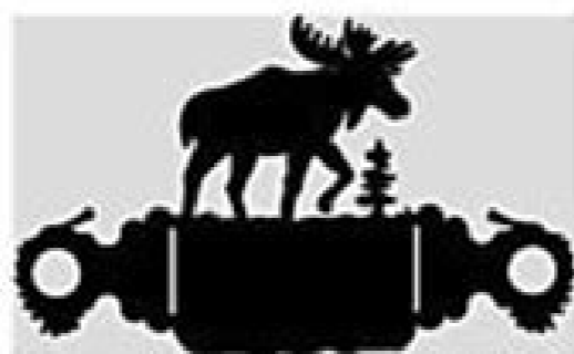
Bath Tissue Holder