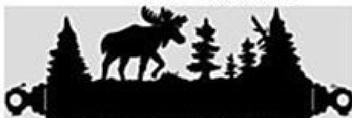
24" Towel Bar