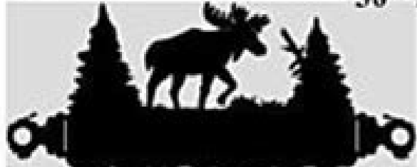
18" Towel Bar